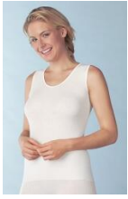
Medima Lingerie Kaschmir/Seide Damen-Hemd ohne Arm weiß