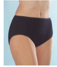
Medima Lingerie Kaschmir/Seide Damen-Taillenslip schwarz

inkl. 19% MwSt., inkl. Versandkosten für Deutschland