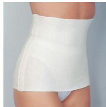
Medima Classic ThermoAS Rückenwärmer hohe Wärmeisolation, haut

inkl. 19% MwSt., inkl. Versandkosten für Deutschland