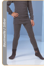
Medima Antisept Kinder-Hose lang unisex, asphalt

inkl. 19% MwSt., inkl. Versandkosten für Deutschland